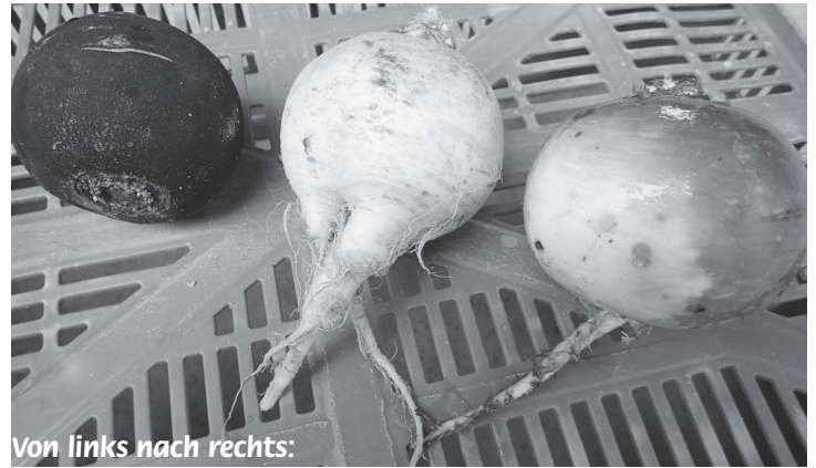
Von links nach rechts:

Wurzel Petersilie, Pastinake (eingefurchter Blattansatz), Küttiger Ruebli, White Satin Ruebli (ähnlich Pfälzer Ruebli, weniger gelb)